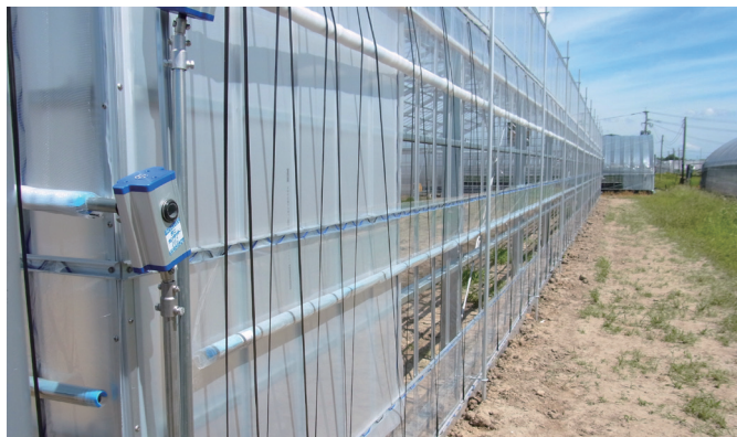
サイド2段巻上&止水