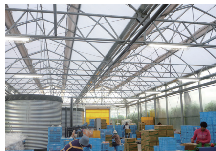
农产品筛选装箱发货设施